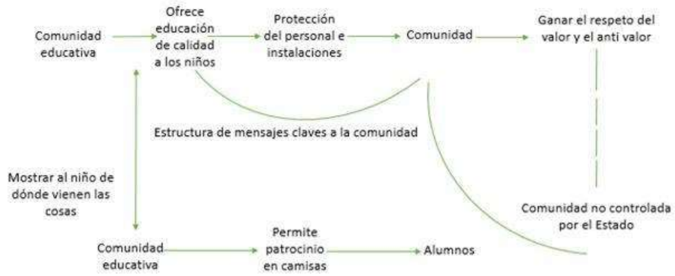
Figura 1: Diagrama de Lasswell aplicado a la comunidad.