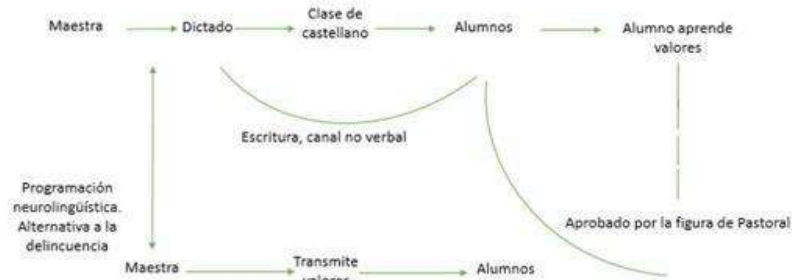
Figura 3: Diagrama de Lasswell con modificaciones de Nixon en el aula de clase. Fuente Autor (2017).

Finalmente se aplicó el modelo a los distintos contextos educativos. Aquí el esquema de Lasswell y Schramm en el salón de clases.